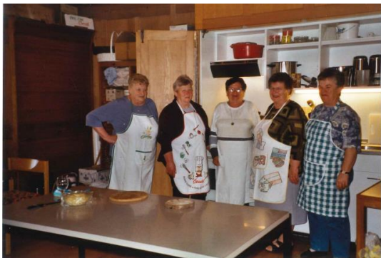
Foto: 10 Jahre Mittagstisch, Januar 2003