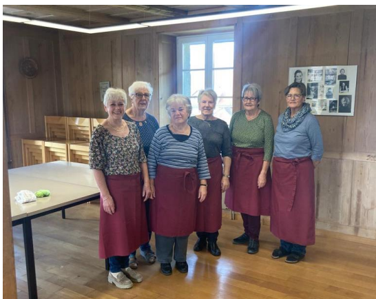
Foto: Mittagstisch von Heute

Das Angebot deckt ein Bedürfnis von Seniorinnen und Senioren ab. Es ist unterdessen ein Treffpunkt, an dem ein reger Austausch stattfindet. Deutlich spürbar wurde dies während der Coronapause. Der Mittagstisch und die damit verbundene Geselligkeit wurden vermisst. Heute werden monatlich von September bis Mai zwischen 30 bis 40 Gäste kulinarisch verwöhnt mit einfachen Eintopfgerichten im Januarloch bis zu einem festlichen Weihnachtsmenu.